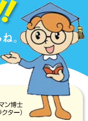
ヒューマン博士 (福岡県の人権啓発キャラクター)

県が、部落差別の解消を推進するために条例を改正しているね。ヒューマン博士に条例のことを教えてもらいましょう。