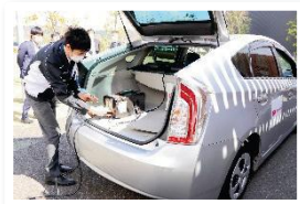
▲Re-Q(非常時発電キット)