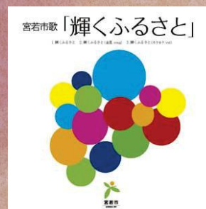
市歌／輝くふるさと

合併を記念するイベントとして行われたミュージカルで歌われた曲を宮若市歌として制定しました。