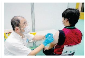
▲新型コロナウイルスワクチン接種状況