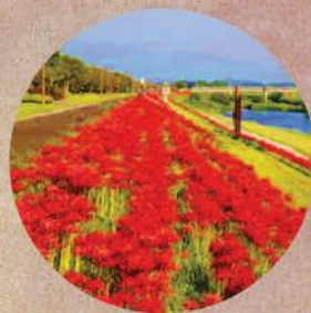
市花／彼岸花【ひがんばんな】

どんな天候でも毎年花を咲かせ、堅実な歩みを目指す宮若市にふさわしいことから選ばれました。