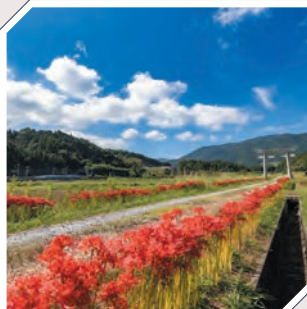
宇佐八幡神社一の鳥居