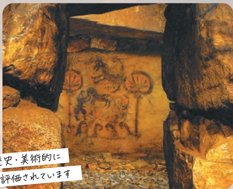
歴史・美術的に 高く評価されています