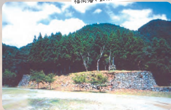
福岡藩で最後に建てられた城館

6世紀後半に築造された直径約18m・高さ約6mの円墳。複室の横穴式石室の計3カ所に、黒や朱の古代顔料で船や龍、朱雀、馬を引く人物、鬚(さしば=うちわのようなもの)などが描かれています。これほど鮮明に残った装飾古墳は全国でもまれで、国の史跡にも指定されました。