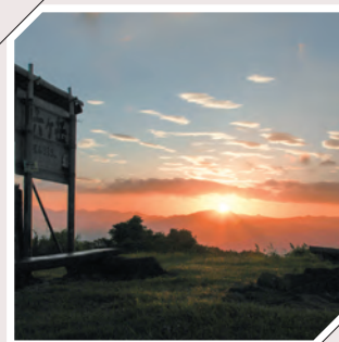
六ヶ岳から望む朝陽