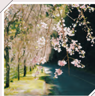
カ丸ダム周辺のしだれ桜