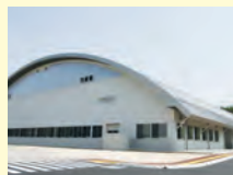
B アリーナ (多目的屋内施設)