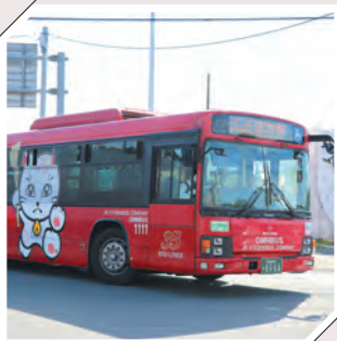
追出し猫が描かれたJRバス