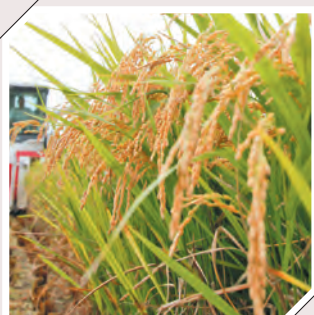
宮若はおいしいお米の産地