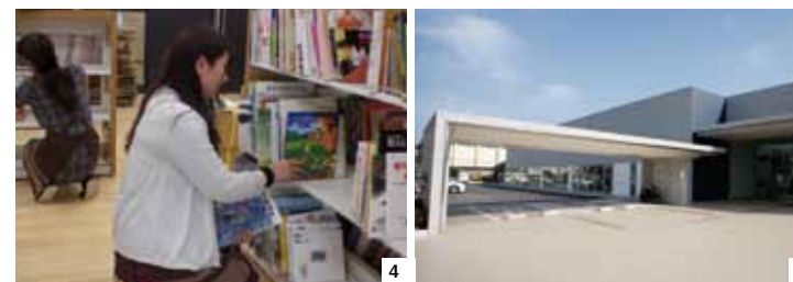
1 購入した図書が図書室へ届きます。2 届いた図書は1冊ずつ購入した資料かどうかをチェックします。3 チェックの済んだ図書は図書室の本であることがわかるように蔵書印を押すなどの作業を行います。 4 どのように本を並べたら利用しやすいかなどを考えながら作業します。5 外構工事も着実に進む若宮コミュニティセンター。開館が楽しみです。