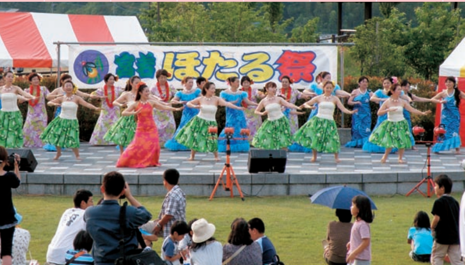
宮若ほたる祭（フラダンス）