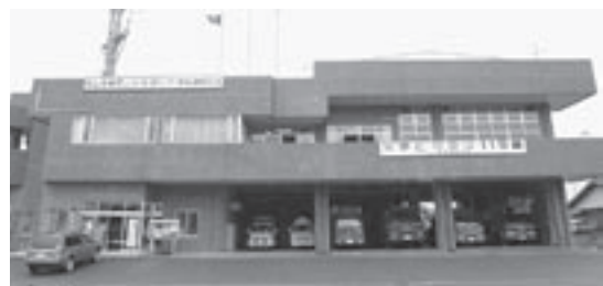
直鞍広域圏消防本部