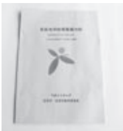
宮若市学校等整備方針

今後は、各種アンケートのほか、児童・生徒や保護者並びに地域の方々にも参画していただきながら計画策定に向けた取り組みを進めていきます。