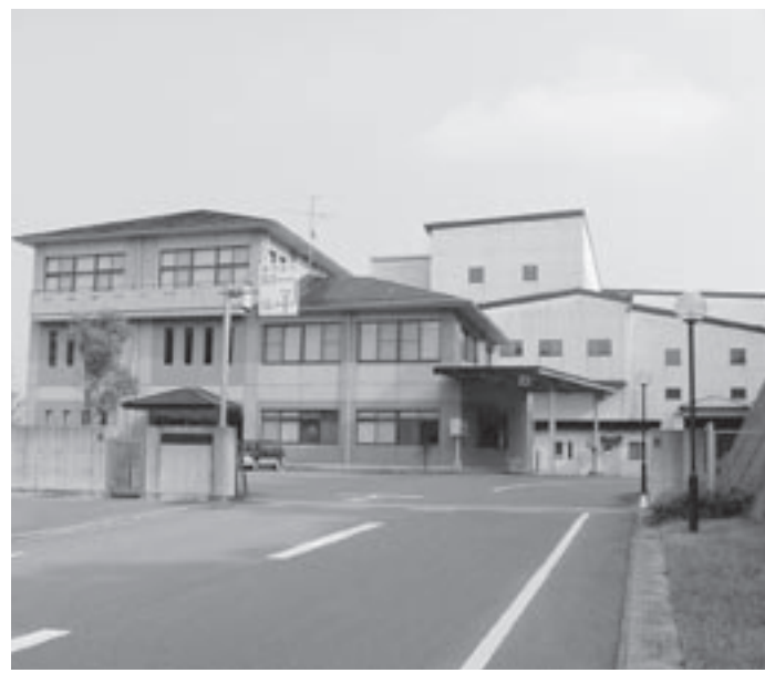
くらじクリーンセンター