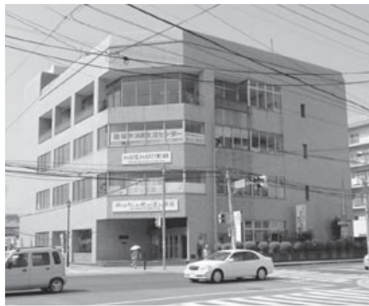
飯塚市消費生活センター（飯塚市役所前）

消費生活相談窓口については、筑豊地域は飯塚市消費生活センターに併設された県の消費者協会飯塚支部の相談員さんが窓口となっていますので、今後とも県の機関等との連携を図りながら、消費者対策に努めていきます。