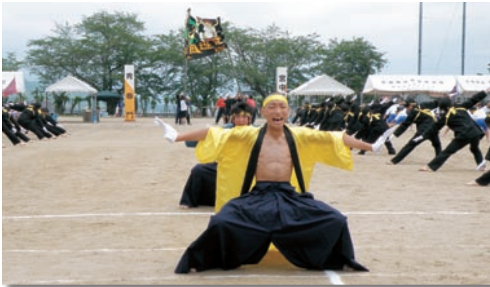
宮田中学校の体育祭