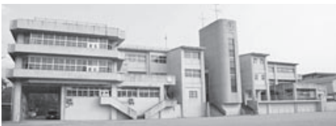
避難場所の一つ 宮田南小学校

答 市長 校舎や体育館等、学校の施設は地域コミュニティ活動の拠点や災害時の避難場所としての役割も持っており、さらに地域住民の拠点となるべき施設でもあります。安全と安心を確保するという観点からも学校の整備と併せた耐震対策を早急に行う必要があると思います。 しかしながら、本市の学校施設については、学校規模の適正化と、耐震を