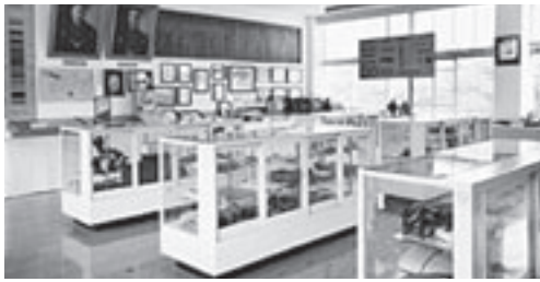
石炭記念館の展示室

次に、各自治会との関係についてですが、地域担当制を導入しても、各自治会のあり方は、今までと何ら変わりはないものと考えていますが、この制度を構築することにより、協働のまちづくりを推進し、地域と行政の双方にメリットが生じるものとなることを目指していますので、自治会への事前の説明を行うとともにご理解とご協力をお願いしていきたいと考えています。