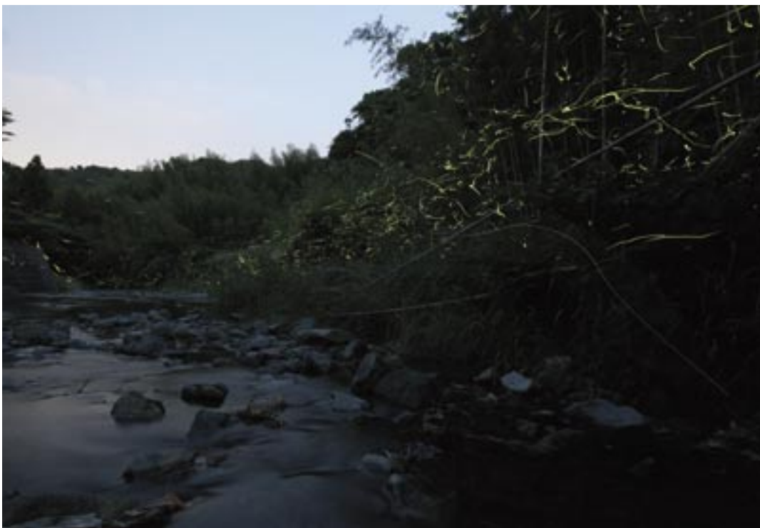
ホタルの乱舞（犬鳴川・脇田）

傍聴者の方々から答弁の声が小さいという声をたくさんいただきました。答弁時には、マイクとの適切な距離を保ち、はっきりとした口調で簡潔に答弁するように心掛けます。