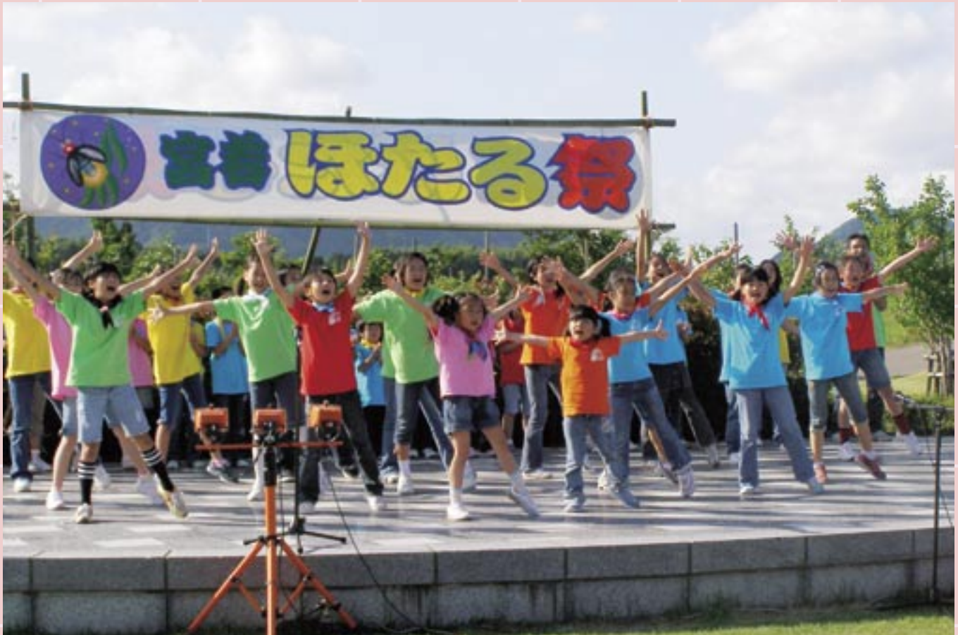
宮若ほたる祭（レインボーカンパニー）