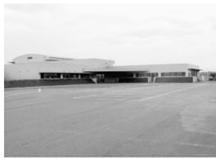
宮若市保健センター「パレット」

ために設置し、市民に利用していただけるようにしているが、今後もし設置目的を基本に健康づくりや子育て支援等のための施設として活用していきたいと考えています。