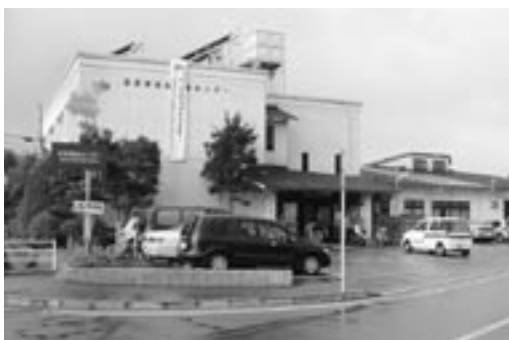
宮若市社会福祉協議会

その結果、3月27日の理事会、29日の評議員会において予算・決算議案、関係職員の処分議案が承認され、社会福祉協議会としてこの問題について整理がなされ、4月26日付けで本市に報告が行われています。また、現在は住民の皆様の信頼の回復と新生宮若市社会福祉協議会の確立に向けた取り組みが行われています。