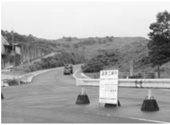
県道21号線バイパス

今後の見通しについては、福岡県と充分協議し、早期完成に向けた取り組みをしていきます。